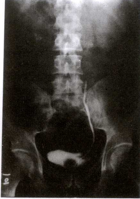
Şekil 3. Hastanın preoperatif retrograd piyelografisinde sol üreterde 15 cm'den itibaren komplet obstrüksiyon görülmektedir.