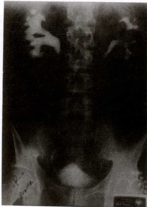
Şekil 4. Hastanın üreteroüreterostomi ve omentum sarılması uygulandıktan sonraki postoperatif 3. Ayda çekilen İVP'si; Sağ üreter üst ucunda görülen daralma geçirilen operasyonlara bağlı olabileceği gibi, yeni bir immün atak sonucunda da olabilir.