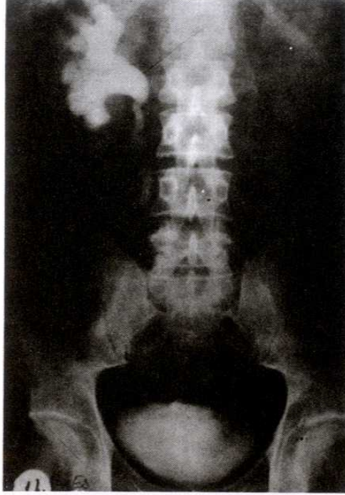
Şekil 1. Hastanın preoperatif alınan geç zamanlı İVP'sinde; Sol böbrek nefrogram fazında kalmakta ve sağ üreter üst ucu L4 seviyesine kadar dilate görünümündedir.