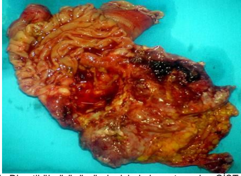
Şekil 1. Divertikül görünümünde, içinde hematoma olan GİST