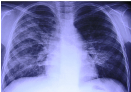
Şekil 2. Olgunun akciğer grafisinde bilateral yaygın infiltrasyon.