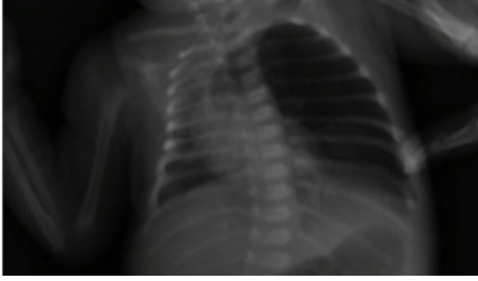
Şekil 1. Sol akciğerden sağ akciğere mediastinal shift

hiperaerasyon, etkilenen lobun komşu akciğer dokusuna basısı ve karşı akciğere herniasyonu ile karakterize klinik bir tablodur. Sıklığı 20000-30000 doğumda 1 olan nadir bir konjenital anomalidir ve erkeklerde üç kat daha fazla görülmektedir. İlk defa 1932'de Nelson tarafından tarif edilmiştir. Histolojik olarak edinsel amfizemdeki doku hasarı yoktur; normal asinüsler ve aşırı genişlemiş alveoller mevcuttur. Nadir görülen gelişimsel bir konjenital akciğer anomalisi olan konjenital lobar amfizem genellikle tek taraflı olup çoğunlukla sol üst lobu (%42) tutar, sağ orta lob %35 oranında etkilenir fakat herhangi bir akciğer lobu da tutulabilir (3). Bilateral KLA tablosu nadir olarak bildirilmiştir (4). Konjenital lobar amfizem olgularının çoğunun kesin nedeni bilinmemekle (%50) birlikte, en sık konjenital kartilaj defektleri (%25) sorumlu tutulmaktadır (5). Geri kalan %25 olguda ise bronşial obstruksiyona sebep olan anormal mukozal katlantı, mukoz plaklar ile anormal kardiyopulmoner damarlanma, daha nadir olarak intratorasik kitleler etiolojide rol almaktadır (6,7). Konjenital lobar amfizemde aşırı derecede havalanan ve ventilasyonu ile perfüzyonu ileri derecede azalmış olan lob, yaptığı bası nedeniyle sağlıklı lobların da ventilasyonunu engeller.