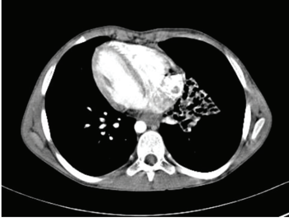
Resim 1A. Axial toraks BT görüntüde mediasten penceresinde dekstrocardi izlenmekte.