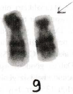
Şekil 1. 9/13 dengeli translokasyon taşıyıcısı anneden parsiyel karyotip

segmentin büyüklüğü ile ilişkilidir. Genelde dublike olan segment ne kadar büyükse, ortaya çıkan anomalilerde o kadar şiddetlidir (5,7,12). Bugüne kadar bildirilen parsiyel trizomi 9 olgularında, dublike olan segmentin farklı kromozom band bölgelerini içeren geniş bir spektrum gösterdiği ve bu spektroma bağlı olarak ortaya çıkan anomalilerin değişiklikler gösterdiği saptanmıştır (7,8,13,14). Literatürde bildirilen ve farklı bant bölgelerini içeren parsiyel trizomi 9 olguları incelendiğinde 9p 21 → p ter olgularının Rethoré Sendromunun tipik yüz görünümüne sahip oldukları, bunun yanında nadiren iskelet veya iç organ anomalilerinin bulunduğu açıklanmıştır. Parsiyel trizomi 9p 11 → pter olgularının da mikrosefali, hipertelorizm, antimongoloid yüz, büyük belirgin burun, köşeleri aşağıya çekilmiş bir ağız ve büyük kulaklar ile Rethoré sendromunun tipik yüz görünümüne sahip oldukları bildirilmiştir. Ancak parsiyel trizomi 9p 11-13 → pter olgularında