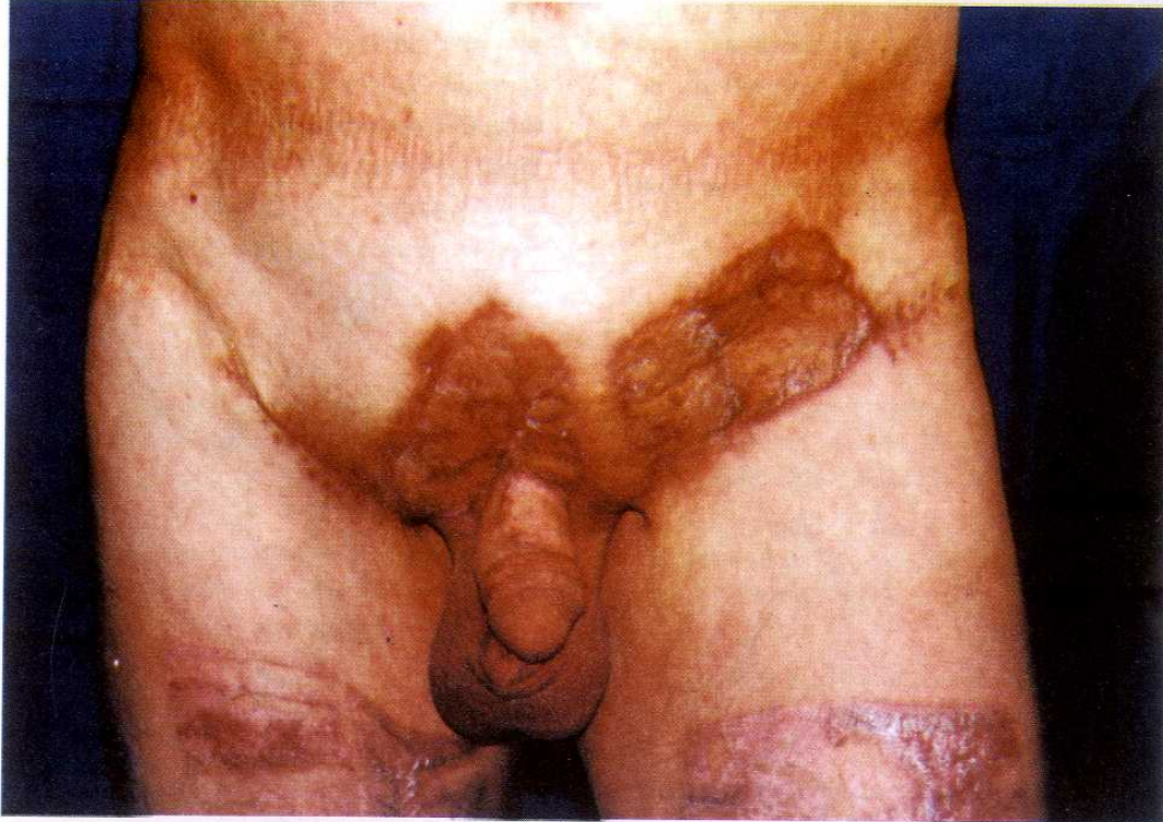
Şekil 4: Post-op 1 yıl sonra nüks rastlanmadı. Hastanın her iki bacağına görülen kızamık alanlar ince kalınlıkta cilt grefti donör alanlarıdır.