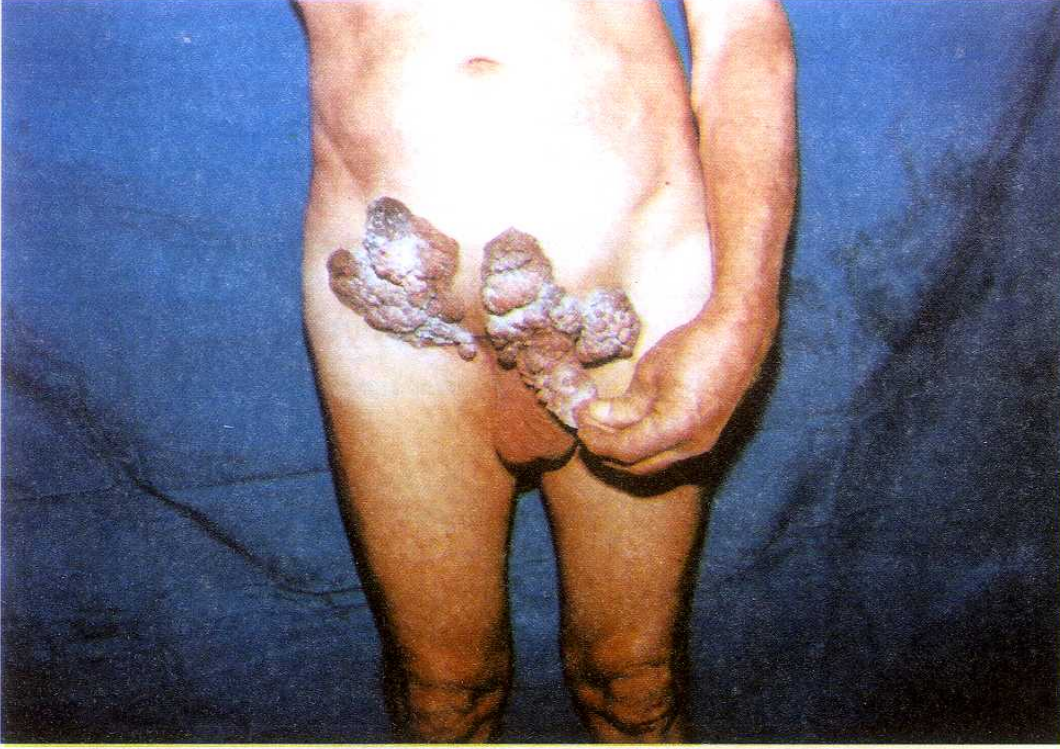
Şekil 1 : Karın alt kadrın, inguinal bölge, glans hariç tüm penis cildini ve kısmen skrotumu tutan lezyon.