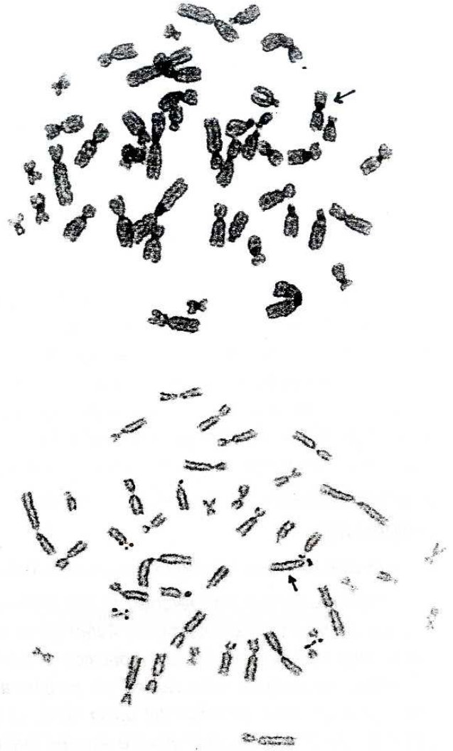
Şekil 2. Olgunun C ve NOR bandlama yöntemi ile bandlanmış metafaz örnekleri.

(37 u/L) düzeylerinin yüksek olduğu görüldü ve WBC ( 14.37 \times 10^6/\mu\text{L} )'in yüksek, RBC ( 3.99 \times 10^6/\mu\text{L} ) ve Hgb (9.3)'in düşük olduğu tesbit edildi. Tiroid hormonları ve diğer hormon düzeyleri normal bulundu. Yapılan batin ultrasonografisi, elektrokardiografisi ve kraniyal CT'sinde hiçbir patolojik bulguya rastlanmadı.