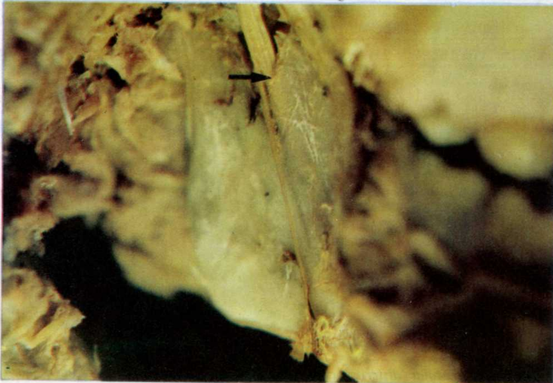
Resim 1. Molar dişlerin occlusial yüzleri seviyesinin üstünde n. alveolaris inferior'un foramen mandibulae'ya girişi.

Foramen mandibulae'nın molar dişlerin occlusial yüzlerine göre seviyelerinin tesbiti sağ ve sol tarafta