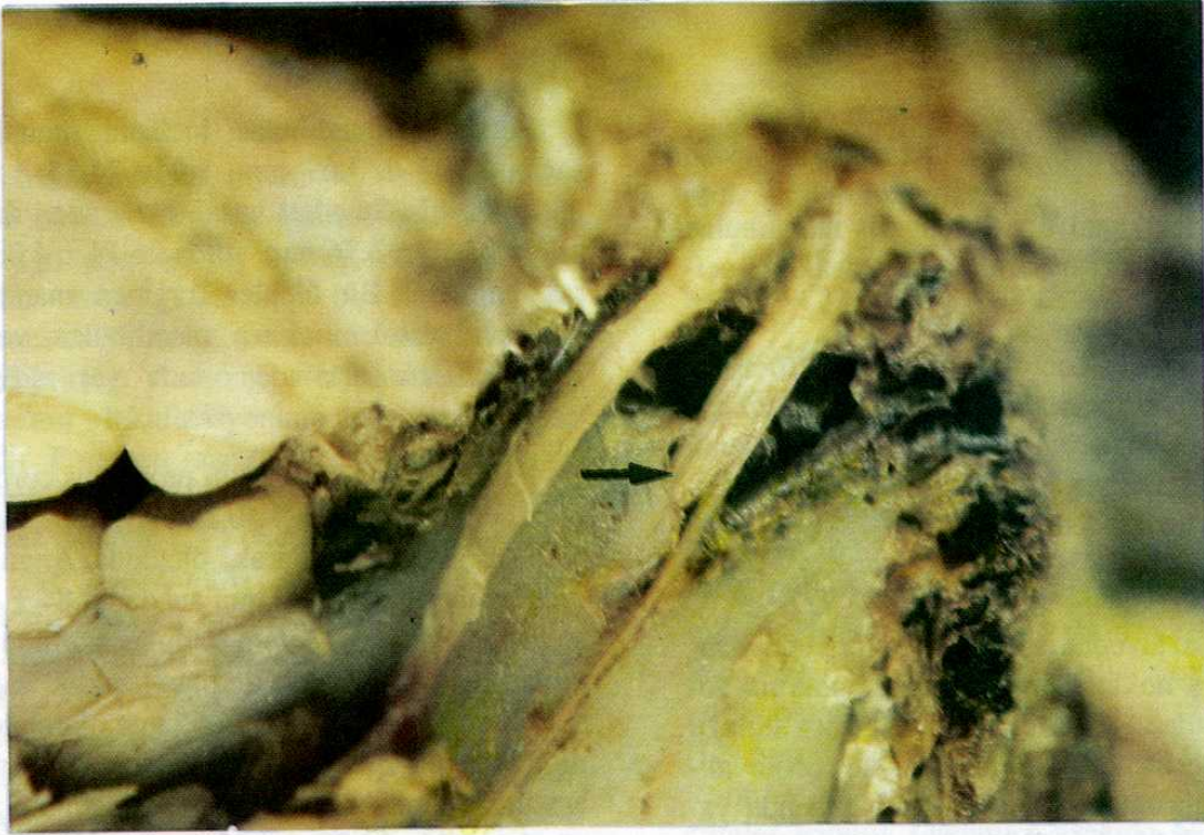
Resim 2. Molar dişlerin occlusal yüzleri ile aynı seviyede n. alveolaris inferior'un foramen mandibulae'ya girişi.