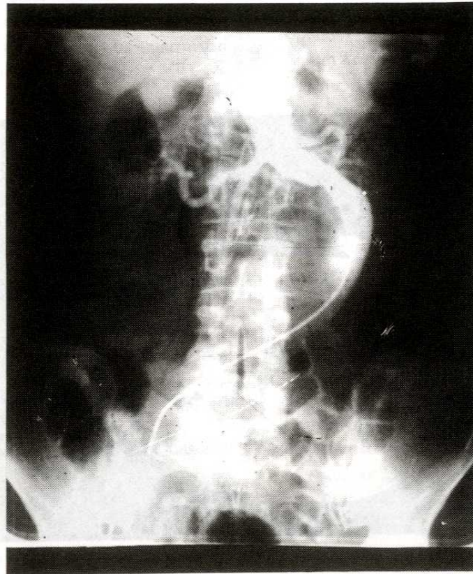
Resim 2. Aortografide abdominal aort anevrizmasının renal arterlerin distalinde başladığı görülmektedir.