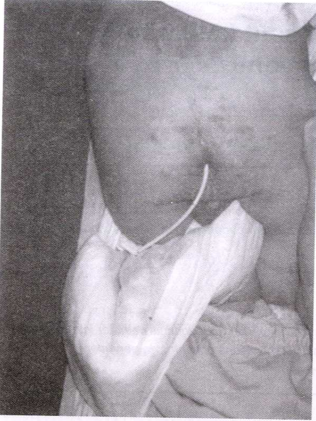
Şekil 1. Anüsten çıkan peritoneal kateter.