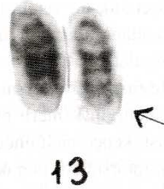
Şekil 2. Yenidüzenlenmiş 13 (der 13) saptanan bebekten parsiyel karyotip