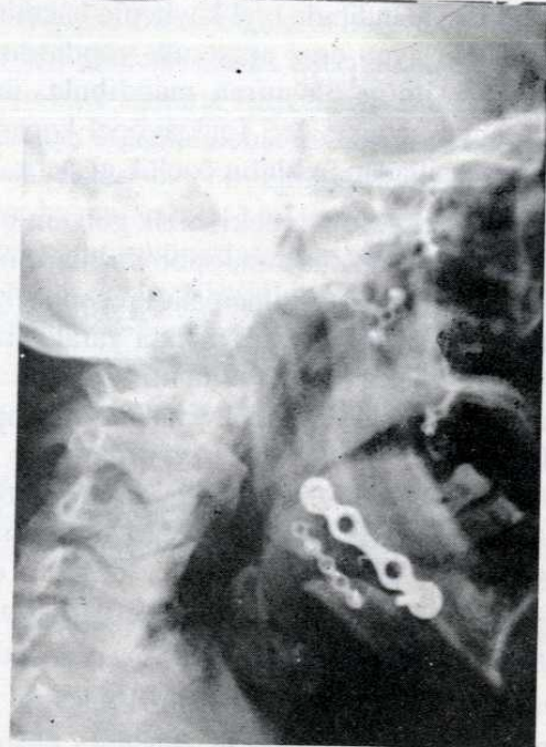
Resim 2: Hastanın postoperatif lateral direkt kraniyografisi

Hastanın 1. ve 3. ayda yapılan kontrol muayenelerinde geçirdiği operasyonla ilgili herhangi bir şikayetin olmadığı görüldü. Çektirilen kontrol grafilerinde uygulanan greftin ve plakların fonksiyonel olduğu tesbit edildi. Hasta 3. ayda alt ve üst çeneye diş protez tatbiki amacıyla Diş Hekimliği protez servisine sevk edildi (Resim 2).