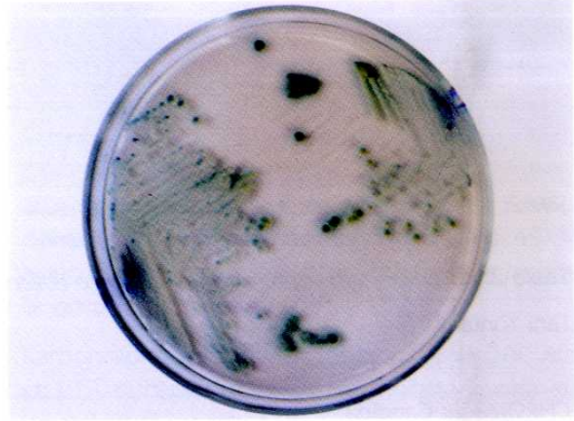
Şekil 1: CHROM Agar Candida besiyerinde Candida albicans 'a uyan kolonilerin makroskopik görünümü

C. albicans olarak stoklanan suşlardan en eski C. dubliniensis tanımlaması 1957 yılında postmortem bir akciğerden elde edilen stok suşundan yapılmıştır (6, 10). Türkiye'deki ilk izolasyonlar 1998'de Hilmioğlu ve ark. ile 1999'da Yücel ve ark. tarafından yapılmıştır (7, 11). C. dubliniensis 'in