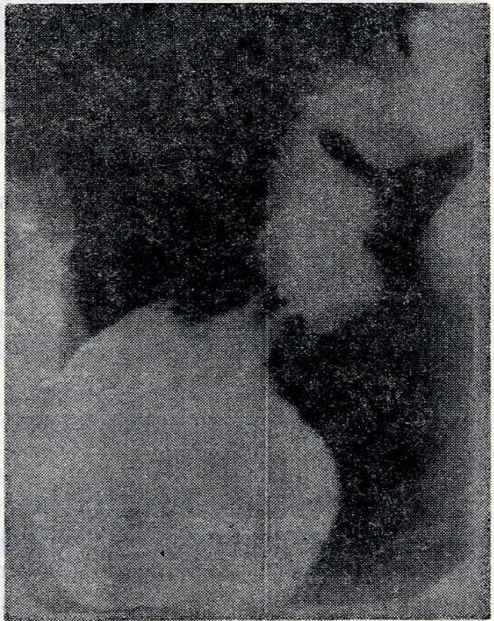
Şekil 1 : Lavman barite ile çekilmiş kolon grafisinde çekimde dolma noksanlığı.