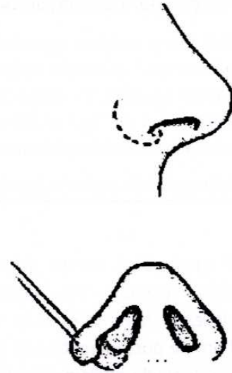
Şekil 2: Alatomî insizyonu.