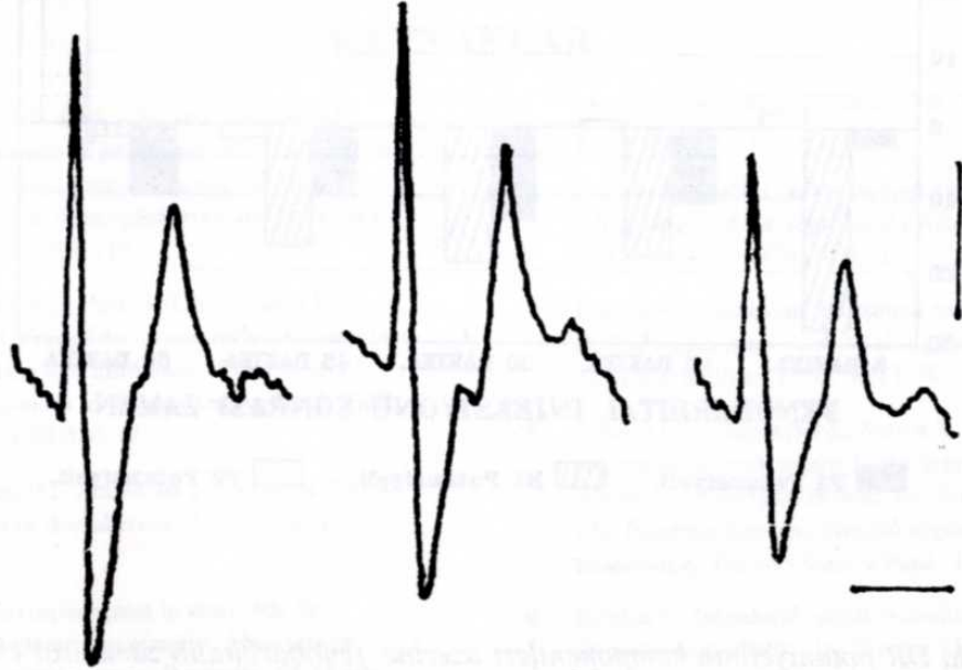
Şekil 2 . Bir olguda fenobarbital verilmesinden önce (sol trase), fenobarbital verilmesinden 5 dakika sonra (orta trase), ve 30 dakika sonra (sağ trase) saptanan CD tipinde potansiyel kayıtlamaları görülmektedir. 5nci. dakika sonunda hafif derecede, 30cu. dakika sonunda ise belirgin düzeyde amplitüd düşmesi görülmektedir. Kalibrasyon 10 mikrovolt, 40 milisaniye