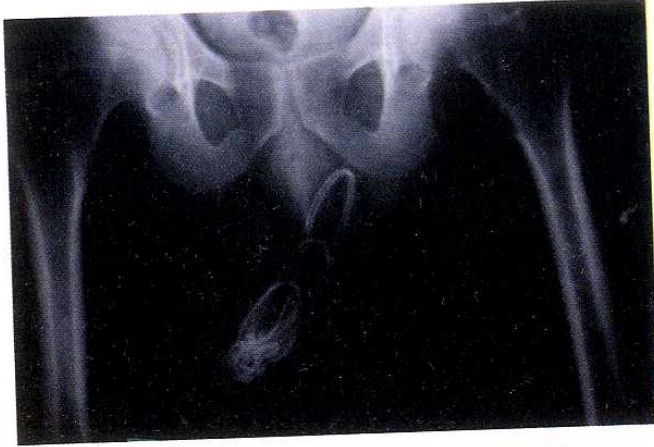
Şekil 1. Radyogramda üretral yabancı cisim.